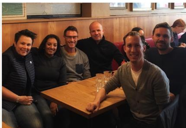
Avkoppling på Island

I augusti kommer ett av de absolut största evenemangen under hela året, nämligen Bellmanstafetten. En nyhet för i år är att det finns en promenadgrupp – och självklart ska vi vara med på det. Vi har anmält 7 lag, varav ett är promenadgruppen. Det innebär att hela 35 Frontrunners ska delta. Verkligen roligt att vi är så många. Lycka till och vi ses den 24 augusti i Stora Skuggan. Om vi tittar längre bort har vi Stockholm halv maraton som väntar. Föreningen deltar i