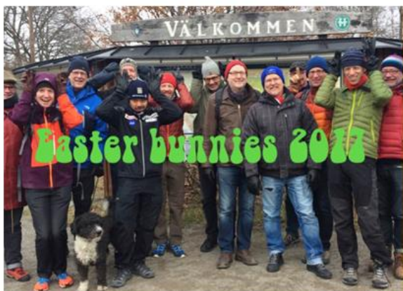
Påskvandring i Hellasgården

Utöver löpning har vi naturligtvis även hittat tid att vara sociala och umgås. Vandringsutflykter, knytkalas, middagar på restaurang, gemensam bowlingkväll med Dolphins och Eurovisionsfest har stått på agendan. På tisdagar under sommaren har vi även börjat med drinks på vandrahemmets uteservering.